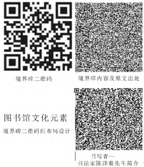
图 1 一组二维码排列实例